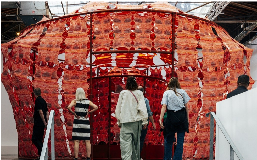
The seventh edition of the exhibition series Positions will be on display at Van Abbeuseum from 13 May to 24 Sep 2023

Kelly Hamers, communicatie & pers M: +31 (0)6 28100149 E: pressoffice@vanabbeuseum.nl