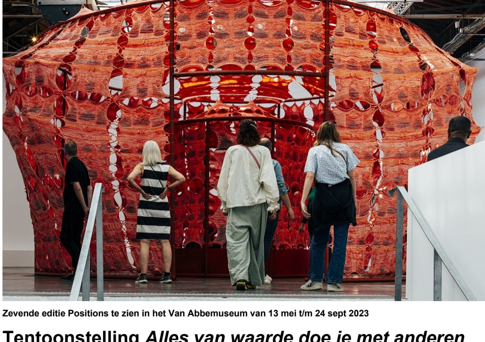
Zevende editie Positions te zien in het Van Abbeuseum van 13 mei t/m 24 sept 2023